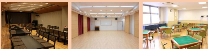
▲ 交流室 ▲ 多目的室 ▲ 娯楽室

がやがや館では、様々な用途に対応できる貸室をご用意しています。舞台や楽屋、AVシステムを備えた「交流室」は、演奏会、カラオケ大会、映写会、謝恩会などにご利用いただけます。「多目的室」もAVシステムを備えており、会議、セミナー、イベントなどにご利用いただけます。両室とも90名程収容可能です。また、レストラン アルトマーレ営業時間内は、お飲み物やお食事のケータリングもできます。