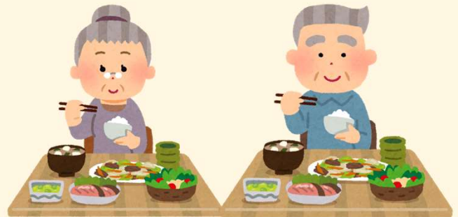
高齢者を対象とした食についての知識を学びます